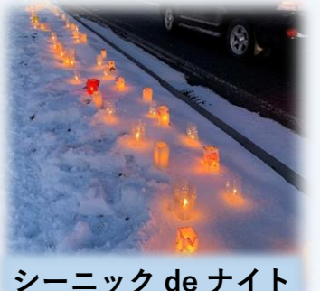
シーニック de ナイト