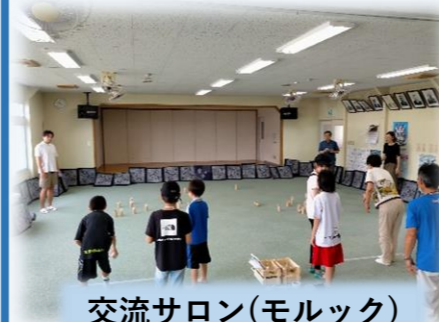
交流サロン(モルック)

見守り・支え合いの活動を町会が中心となり民生委員、学校、福祉施設などの関係機関が一緒に取り組んでいます。