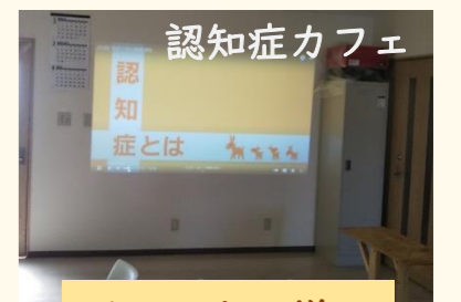
認知症カフェ イベントの様子