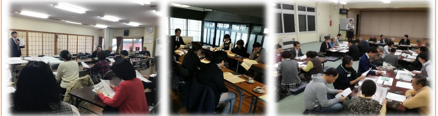
地域ケア会議の様子です

函館市や地域包括支援センターでは、地域ケア会議を開催することで「地域の課題」「地域での見守り・支え合い」「認知症高齢者への支援」などについて皆様と話し合いながら、事業や活動を展開しています。今後も、様々なご意見やご要望を伺いながら、皆様と一緒に『まちづくり』を進めていきたいと思っておりますので、ご協力のほど、宜しくお願いいたします。